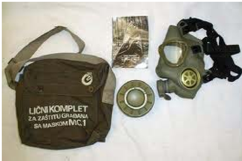
Дел од опрема за РХБ заштита

од почетно ударно, топлотно и радиоактивно дество на гама зраци и неутрони и дополнителното радиоактивно дејство на дождови, внесување на прехранбени производи во организмот и оштетување на системот за варење и системот за дишење. Разновидни хемиски соединенија и биолошки агенси – предизвикувачи на заразни болести и нивните отровни производи – токсини, имаат негативно дејство по здравјето на луѓето.