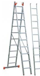
Дел од опрема за дејство против пожар