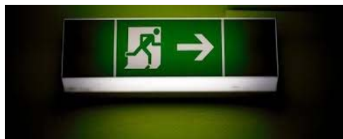
Дел од знаците за евакуација