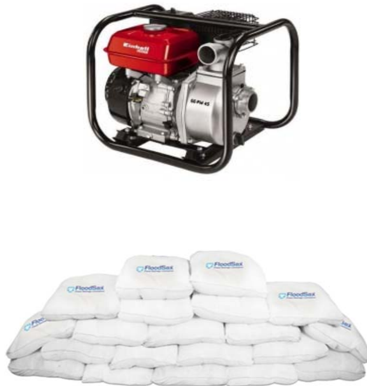
Дел од опрема за заштита од поплави

најчесто се употребуваат: заштитни препреки од дрва, штици, песок, камен, итн. Потребната опрема за расчистување на поплавените објекти опфаќа: лопати, казми, мотики, секири, пили, појаси за спасување, пумпи и црева за испумпување на водата и сл. За спроведување на овие активности потребна е и лична заштитна опрема: заштитни одеа и кабаници, заштитни чизми и др.