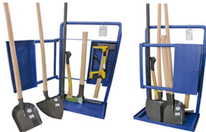
Дел од опрема за заштита од урнатини