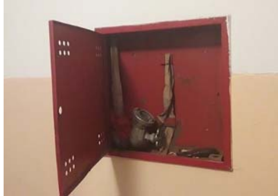
Уништен и нефункционален хидрант