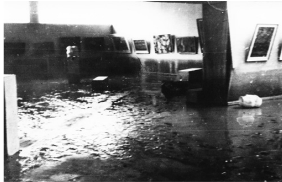
Art pavilion in Skopje after the flood in 1962

The risk is an inevitable part of individual and collective life of man. Risk is defined as the interaction between two factors as a feature of any danger or hazard. It can be expressed by the formula: risk = danger + vulnerability / capacity. A particular hazard can cause direct damage, indirect damage, damage to property that can be expressed in money and non-pecuniary damages, which cannot be quantified in money terms, eg., human losses.