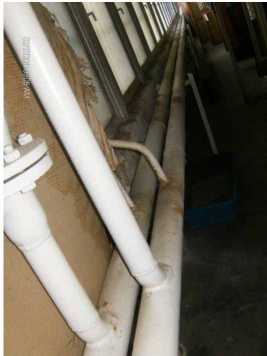
Water supply, sewage pipes and pipes of central heating

To answer these questions it would be good to take a look at some of these photos of depots of some Macedonian museums.