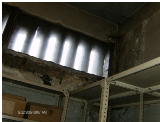
Прокиснување на простории на депоа

Најголем дел се во подрумски простории низ кои врват доводни и одводни цевки. Некои со некоректна влага (а стандардот е 40-60% преку цела година), други со неконтролирана температура (а стандард е 16-25°C) и неконтролирано светло и УВ зрачење, без мерни инструменти, без просторни услови, пренатрупани со предмети, без одговорно лице за ракување или со лице за ракување но без соодветна обука за работа, недоволно обезбедени од кражби. Загрижува фактот дека за одреден број депоа нема посебна стратегија за дејствување, а кај други нема планови за дејство во редовни и вонредни состојби. Музејските колекции во депоата се во сериозен ризик. Се добива впечаток дека многу едноставно се приоѓа кон заштитата на културните добра во депоата, сметајќи дека лесно е справувањето со некоја опасност. Но, без претходно изградена стратегија и без подготвени планови, кои ќе се ажурираат секоја година, загубите при контакт на културните добра со некоја опасност ќе бидат големи.