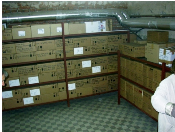
Pipes of central heating