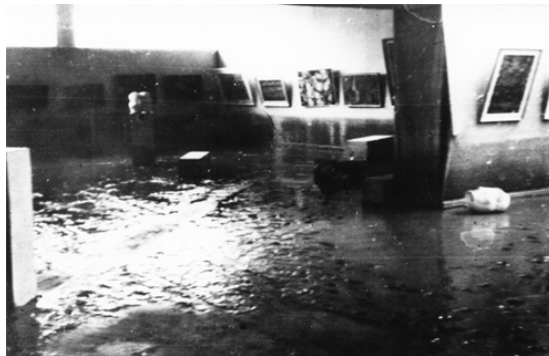
Уметнички павилон во Скопје по поплавата во 1962 година

Познато е дека ризикот е неизбежен дел од индивидуалниот и колективниот живот на човекот. Ризикот е дефиниран како интеракција помеѓу два фактора како карактеристика на секоја опасност. Тоа може да се изрази преку формулата: Ризик = опасност + ранливост / капацитет . Одредена опасност може да предизвика директни штети, индиректни штети, материјални штети кои може да се изразат во пари и нематеријални штети, кои не може да се изразат во пари, пр., човечките загуби.