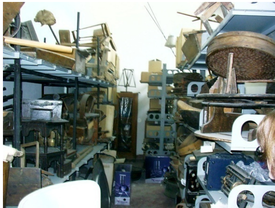
Space filled with objects