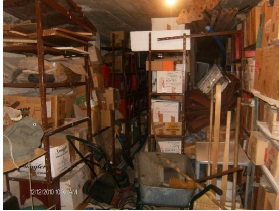
Many objects at small area