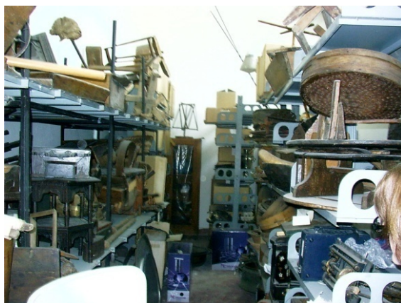
Затрупани простори со мноштво предмети.