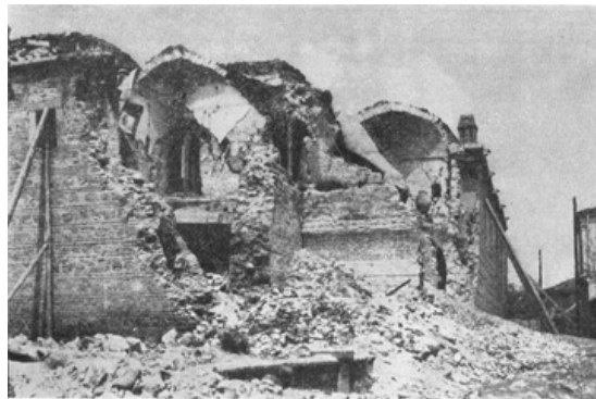
Consequences of the earthquake in Skopje, 1963