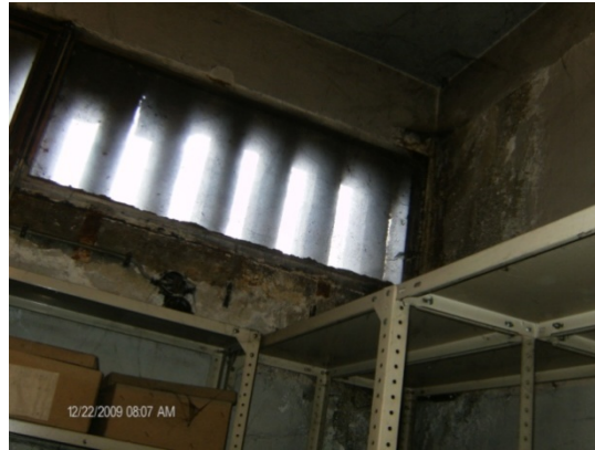
Water leakage in the depot

The depots are usually in basements, in spaces where pipes pass. Some of these rooms have improper humidity level (standard level is 40-60% throughout the year), others are with uncontrolled temperature (standard temperature is 16-25 °C) and uncontrolled light and UV radiation, they lack measuring instruments, lack spatial conditions, they are crowded with objects, there is no staff in charge, or if there is one it is without adequate training, the premises are insufficiently secured from theft. The fact that should be of concern is that certain number of depots have no special strategy for action, and others have no plans for action nor in regular circumstances neither in emergencies. The museum collections in the depots are in serious risk. One gets the impression that the approach towards the protection of cultural property in the depots is quite easy, believing that it is easy to deal with certain danger. However, without a strategy or plans prepared in advance, which will be updated every year, losses of cultural objects due to certain hazard could be high.