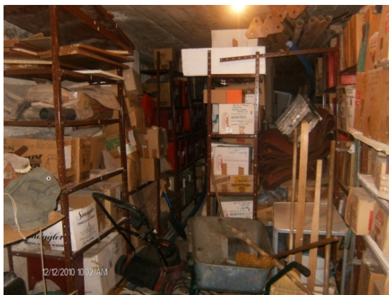
Мноштво предмети во мал простор