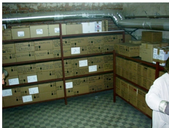
Цевки од парно затопување